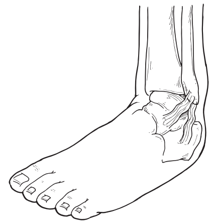
Tobillo lesionado con laxitud de ligamentos

En el proceso de evaluación y diagnóstico de su enfermedad, el cirujano de pie y de tobillo le